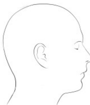
PRAWY / LEWY BOK